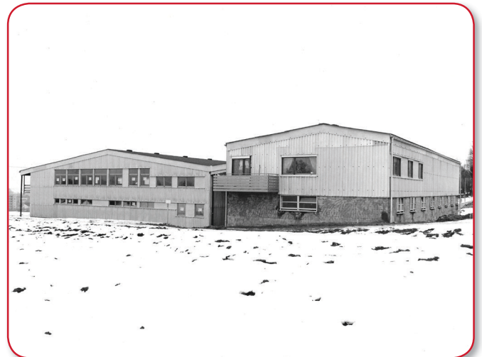
Reitanlage des RVO 1969

Der Verein war der Bauträger der Reithalle, damit die verschiedenen Förderungsbeiträge für diese Reitsportanlage zugeteilt wurden. Nach Ablauf von vier Jahren sollte der Verein an die Stadt Weingarten herantreten und verlangen, dass die Stadt Weingarten wie geplant, die Reithalle mit Anlage übernimmt.