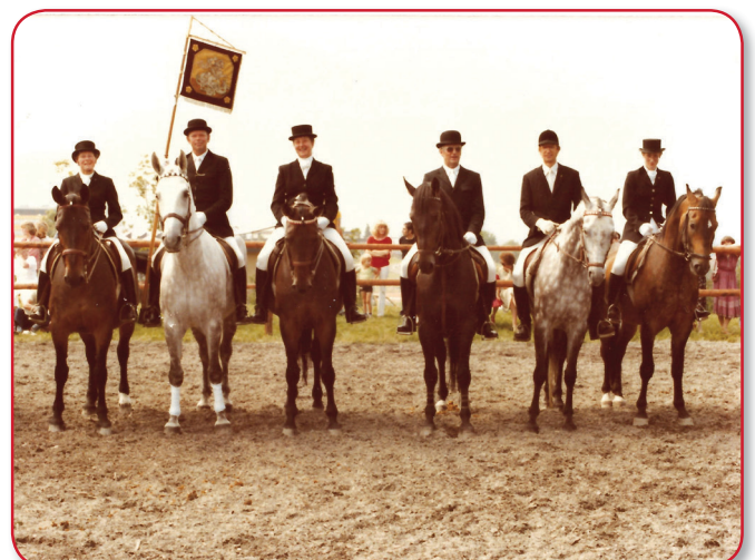
10-jähriges Bestehen des RVO